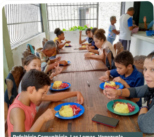
Refeitório Comunitário. Las Lomas, Venezuela