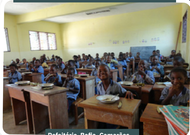
Refeitório. Bafia, Camarões