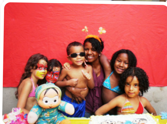
Casa Lar Governador Valladares. Brasil