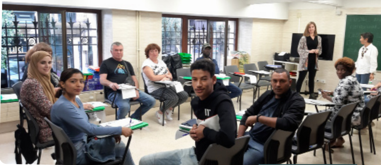
Programa de Alfabetização Ojalá